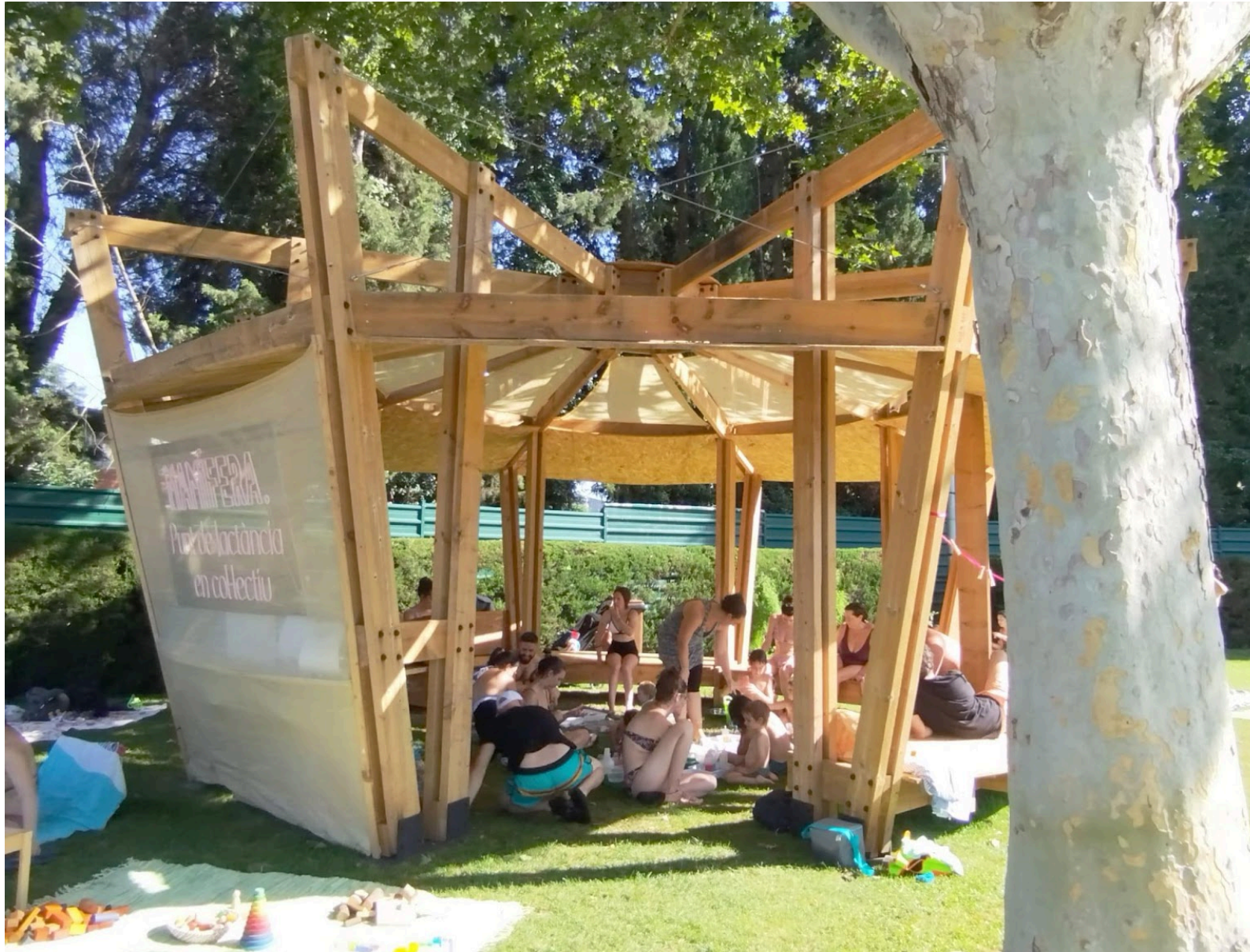
F6. Activitat en el marc de la programació de Mamífera a Abrera.