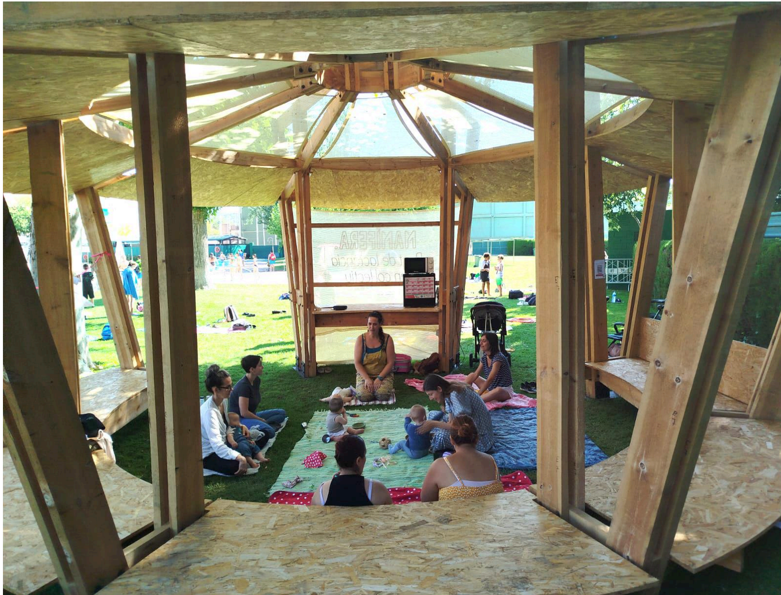
F5. Activitat en el marc de la programació de Mamífera a Abrera.