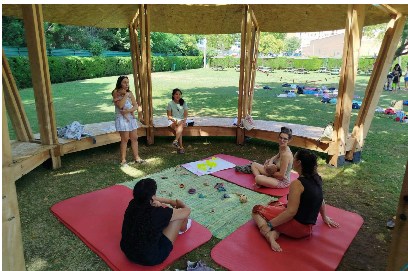
F4. Taller participatiu Com haurien de ser els espais de lactància en col·lectiu?.